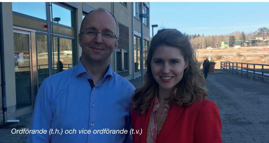
Ordförande (t.h.) och vice ordförande (t.v.)